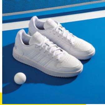
Lifestyle Ayakkabı Adidas Ürünü İncele