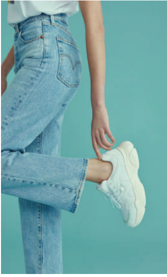
Denim Pantolon Levi's Ürünü İncele