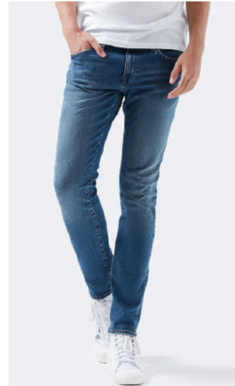
Denim Pantolon Mavi Ürünü İncele