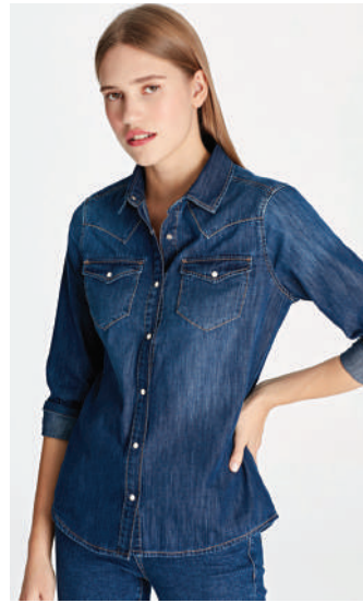
Denim Gmlek Mavi rn İncele