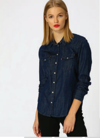
Denim Gömlek Levi's Ürünü İncele