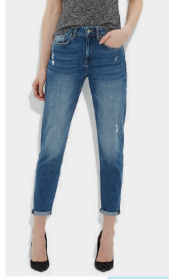
Denim Pantolon Mavi Ürünü İncele