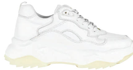
Sneaker Aerostale Ürünü İncele