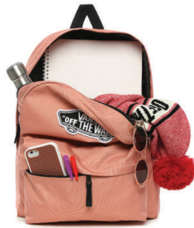
Sirt Çantası Vans Ürünü İncele