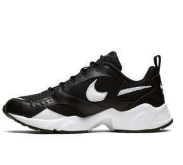
Lifestyle Ayakkabı Nike Ürünü İncele