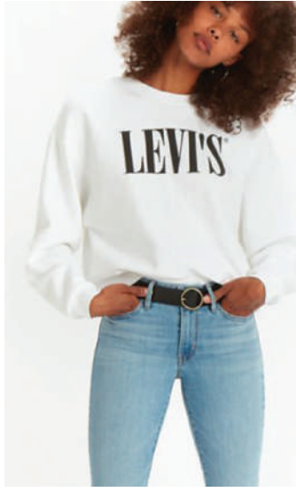
Denim Pantolon Levi's Ürünü İncele