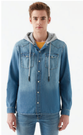
Denim Gmlek Mavi rn İncele