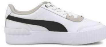
Lifestyle Ayakkabı Puma Ürünü İncele

Şimdi, klasik ayakkabılarınızı evde bırakma ve sneakerlarınızla rahatınıza bakma zamanı.