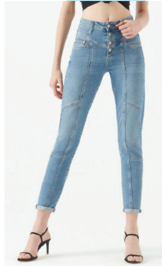
Denim Pantolon Mavi Ürünü İncele