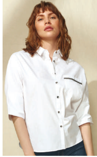
Gömlek Fabrika Ürünü İncele