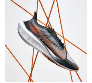
Koşu Ayakkabısı Nike Ürünü İncele