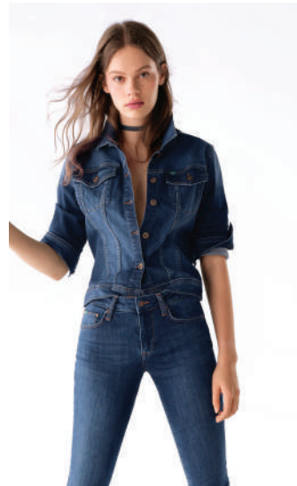
Denim Pantolon Lee Cooper rn İncele