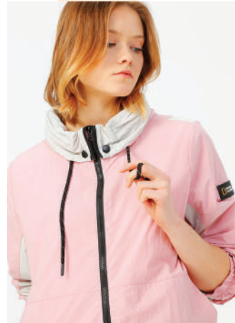
Ceket National Geographic Ürünü İncele