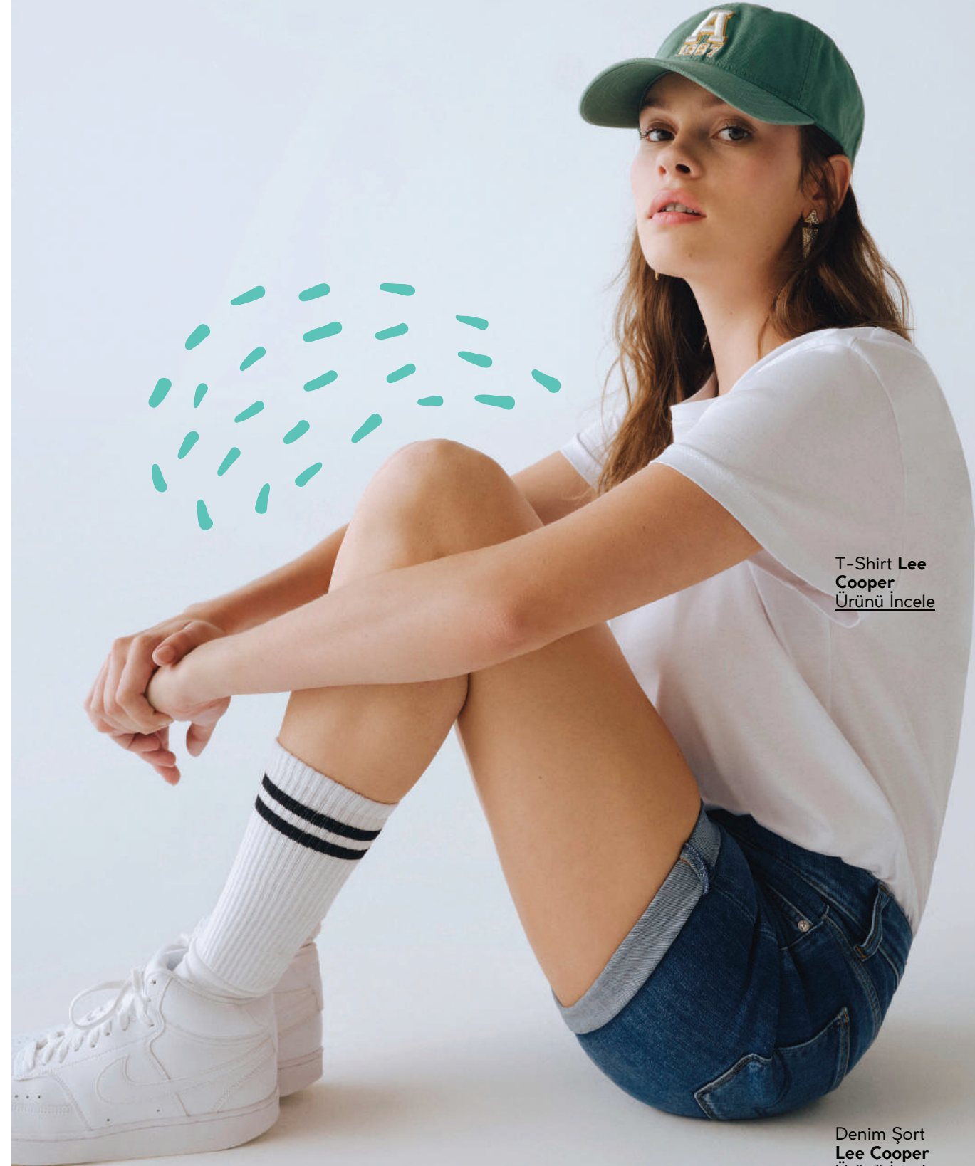
T-Shirt Lee Cooper Ürünü İncele