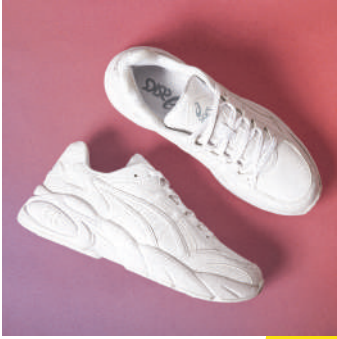
Koşu Ayakkabısı Asics Ürünü İncele