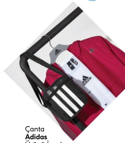
Çanta Adidas Ürünü İncele