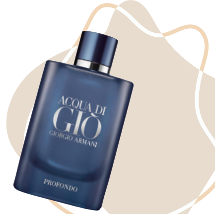
Erkek Parfüm Giorgio Armani Ürünü İncele