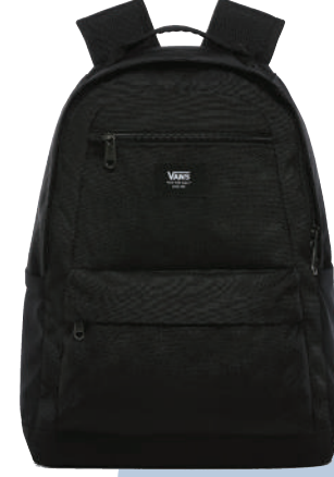
Sirt Çantası Vans Ürünü İncele