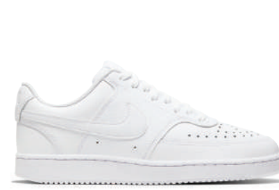
Lifestyle Ayakkabı Nike Ürünü İncele