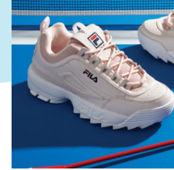
Lifestyle Ayakkabı Fila Ürünü İncele