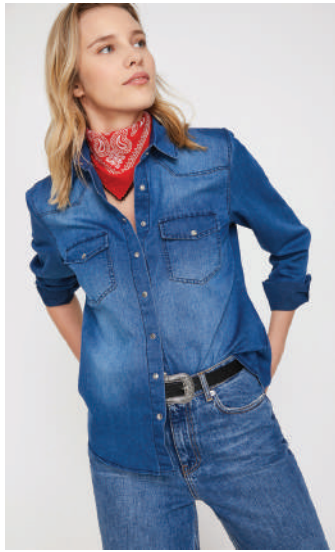
Denim Gmlek Koton rn İncele