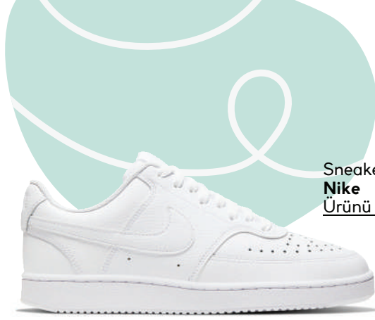
Sneaker Nike Ürünü İncele