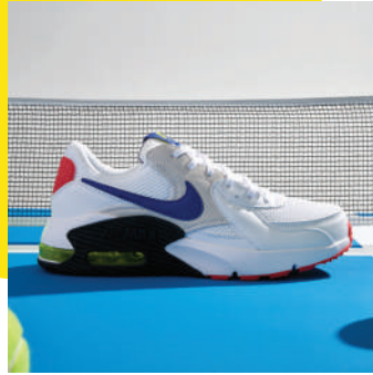
Lifestyle Ayakkabı Nike Ürünü İncele