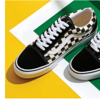
Lifestyle Ayakkabı Vans Ürünü İncele