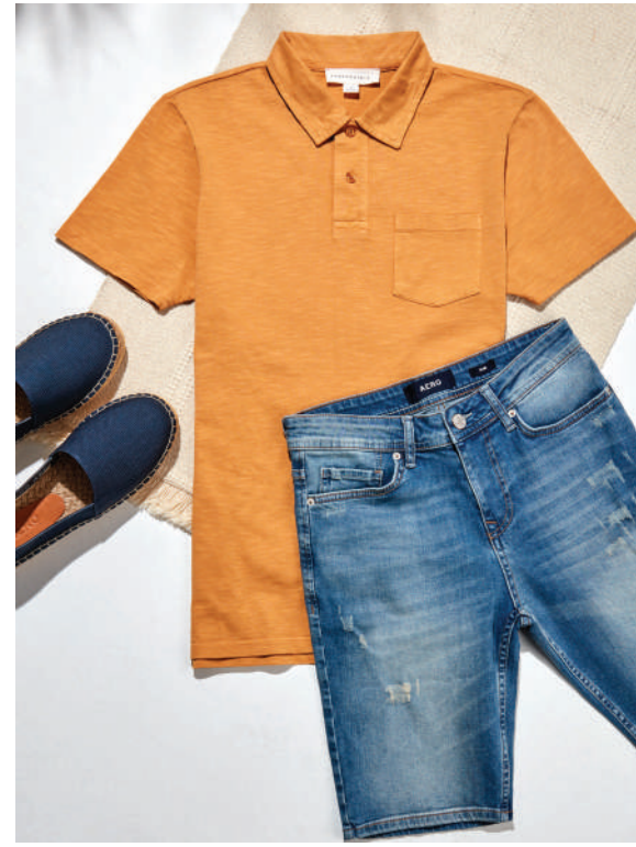
Ayakkabı Aeropostale Ürünü İncele