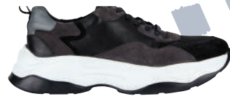
Sneaker Fabrika Ürünü İncele