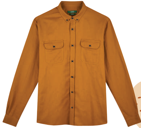
Gömlük Limon Ürünü İncele