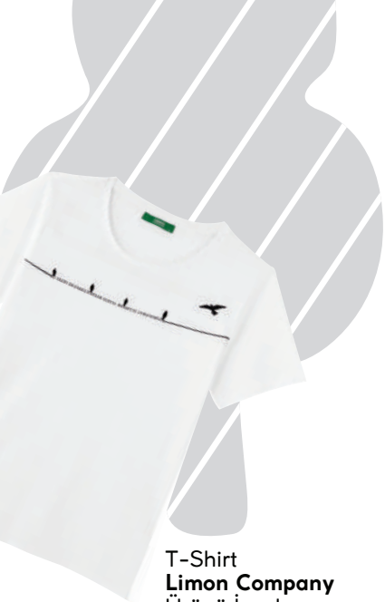
T-Shirt Limon Company Ürünü İncele