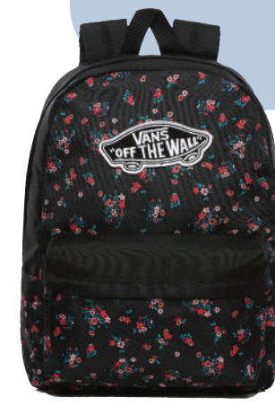
Sirt Çantası Vans Ürünü İncele

Hayatlarımız her geçen gün biraz daha mobil hale geliyor; gün içinde oradan oraya taşıdığımız yüklerimiz artıyor. Sirt çantaları, işte bu günler için var! Sezonun öne çıkan modelleri, jeanlerinize eşlik etmeye hazır, renk ve desenleri itibarıyla arka planda kalamayacak kadar iddialı.