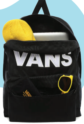
Sirt Çantası Vans Ürünü İncele