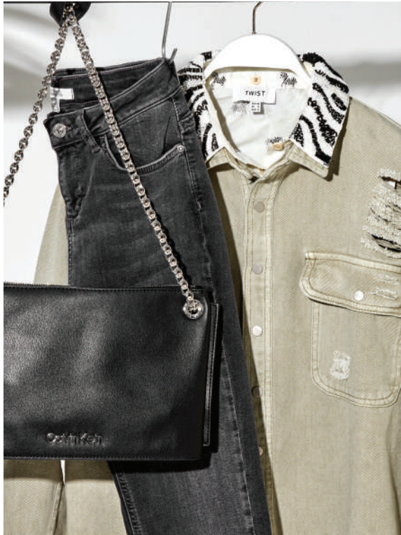
Denim Pantolon İpekyol Ürünü İncele