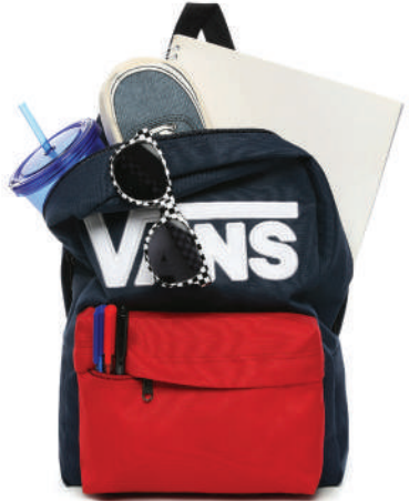
Sirt Çantası Vans Ürünü İncele