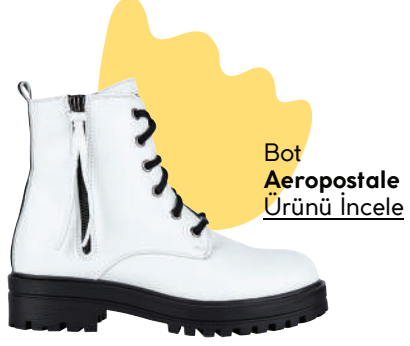
Bot Aeropostale Ürünü İncele