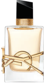
Parfüm Yves Saint Laurent Ürünü İncele