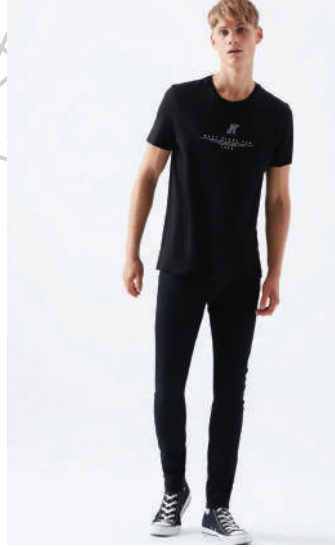
Denim Pantolon Mavi Ürünü İncele