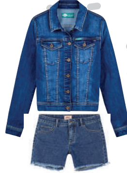
Denim Ceket Lee Cooper rn İncele