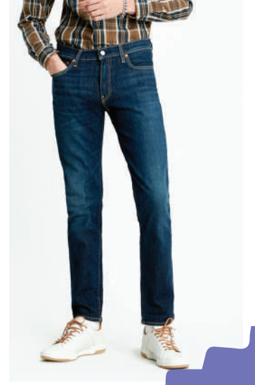
Denim Pantolon Levi's Ürünü İncele