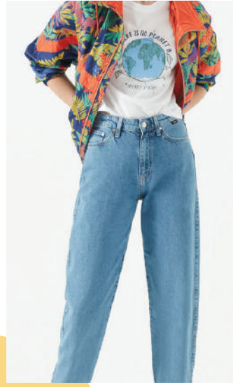
Denim Pantolon Mavi Ürünü İncele

Zamanın ruhuna ayak uydurmak onun işi! Sokakların resmi ve daimi üniforması denim, şimdi de konforlu kalıplarla yaşadığımız zamanlara adapte oluyor. Bir yandan da farklı zevklere (ve vücut tiplerine) hitap etmek için şekilden şekle giriyor. Sezonun denim paletinde, boru paçalar başrolde. Yüksek beli ve bileğe doğru daralan hacimli silüetiyle 90'ları geri getiren mom jeans, daha feminen kalıplarda yorumlanan yeni Boyfriend ve dar kesimlerden vazgeçemeyenleri heyecanlandıracak yeni sürüm skinny jeanler ile seçenekler artıyor.