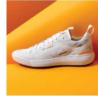
Lifestyle Ayakkabı Vans Ürünü İncele