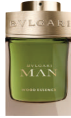
Erkek Parfüm Bulgari Ürünü İncele