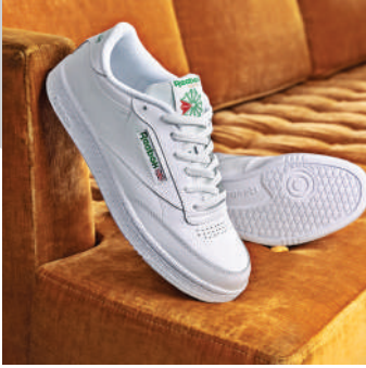
Lifestyle Ayakkabı Reebok Ürünü İncele