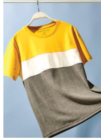
T-Shirt Aerostale Ürünü İncele