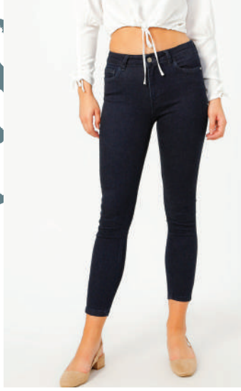
Denim Pantolon Fabrika Ürünü İncele