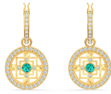
Küpe Swarovski Ürünü İncele