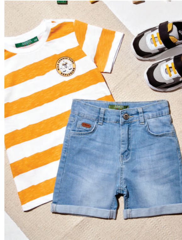
Denim Şort Limon Ürünü İncele