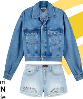
Kapri U.S. Polo ASSN rn İncele

Dilerseniz, 90'lar hatırası denim on denim oyununa, farklı tonlardaki jean paralarla da dahil olabilirsiniz.