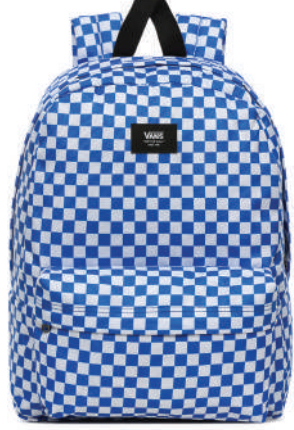
Sirt Çantası Vans Ürünü İncele