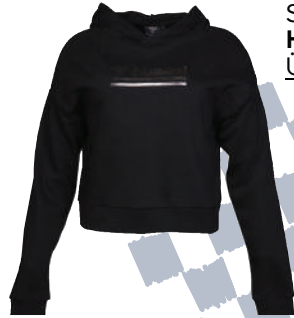
Sweat Shirt Hummel Ürünü İncele