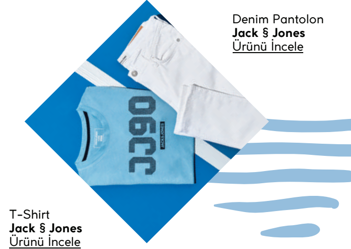
T-Shirt Jack & Jones Ürünü İncele