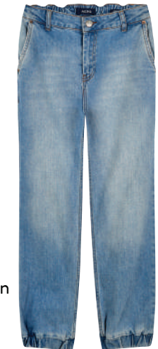
Denim Pantolon Aeropostal Ürünü İncele