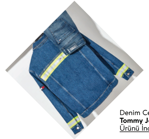
Denim Ceket Tommy Jeans Ürünü İncele