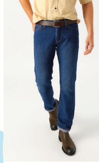
Denim Pantolon Loft Ürünü İncele