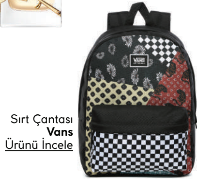
Sırt Çantası Vans Ürünü İncele