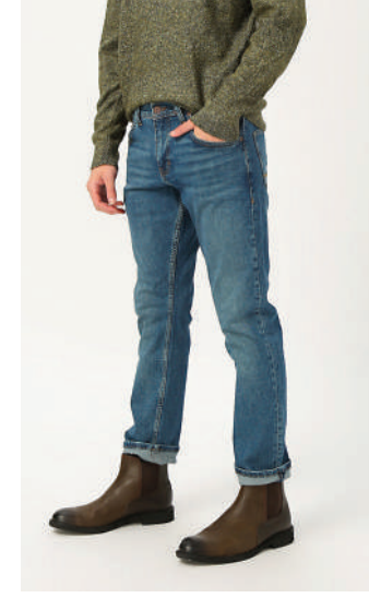
Denim Pantolon Mustang Ürünü İncele