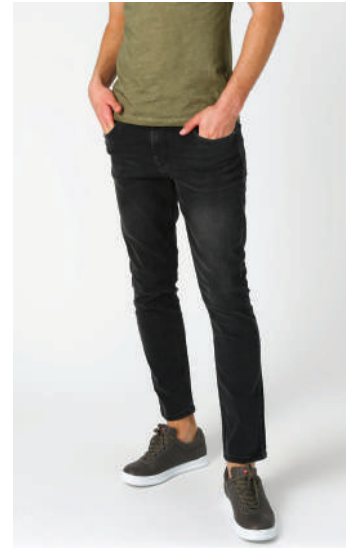
Denim Pantolon Lee Cooper Ürünü İncele