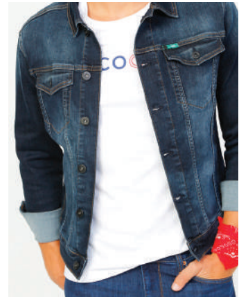
Denim Ceket Lee Cooper Ürünü İncele