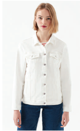
Denim Ceket Mavi rn İncele