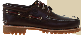
Ayakkabı Timberland Ürünü İncele