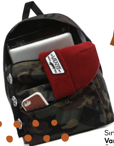
Sırt Çantası Vans Ürünü İncele