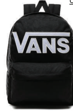
Sırt Çantası Vans Ürünü İncele