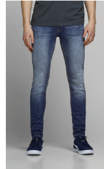
Denim Pantolon Jack Jones Ürünü İncele