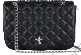
Çanta Fabrika Ürünü İncele