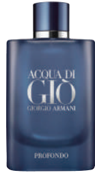
Erkek Parfüm Giorgio Armani Ürünü İncele