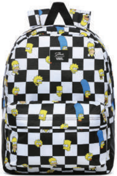
Sirt Çantası Vans Ürünü İncele

Rock'n'roll ruhlu siyah jean, yeniden sahnede! Siyah jeanin asi ve asil duruşunu başka siyahlarla daha da güçlendirmek elinizde.