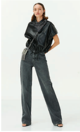
Denim Pantolon Twist Ürünü İncele