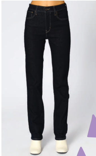
Denim Pantolon Levi's Ürünü İncele