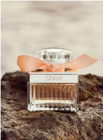
Kadın Parfüm Chloé Ürünü İncele