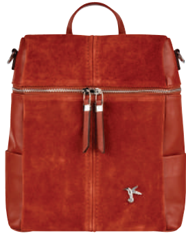
Sırt Çantası, Fabrika Ürünü İncele