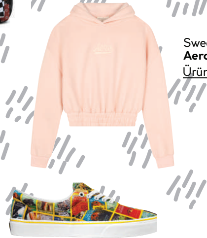
Sweat Shirt Aerpostal Ürünü İncele