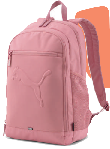
Sirt Çantası Puma Ürünü İncele