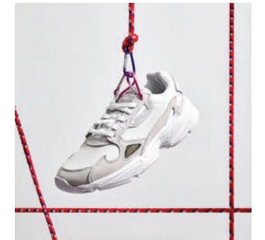
Lifestyle Ayakkabı Adidas Ürünü İncele