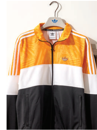
Eşofman Üstü Adidas Ürünü İncele