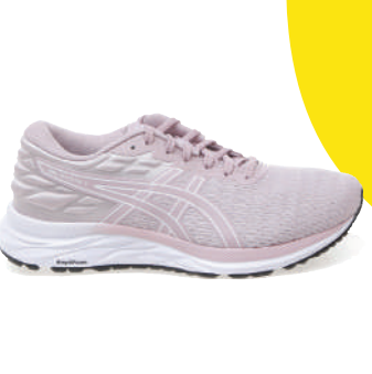
Koşu Ayakkabısı Asics Ürünü İncele