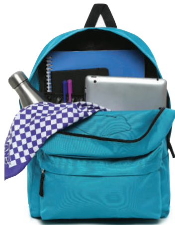
Sirt Çantası Vans Ürünü İncele