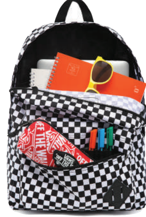
Sirt Çantası Vans Ürünü İncele