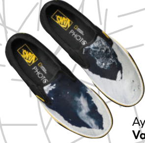
Ayakkabı Vans x National Geographic Ürünü İncele