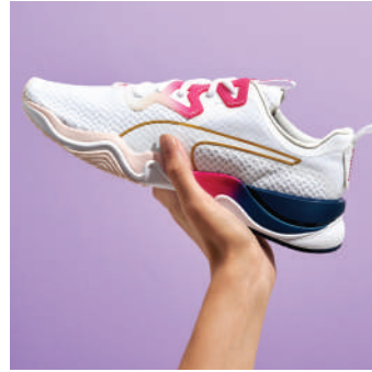
Koşu Ayakkabısı Puma Ürünü İncele